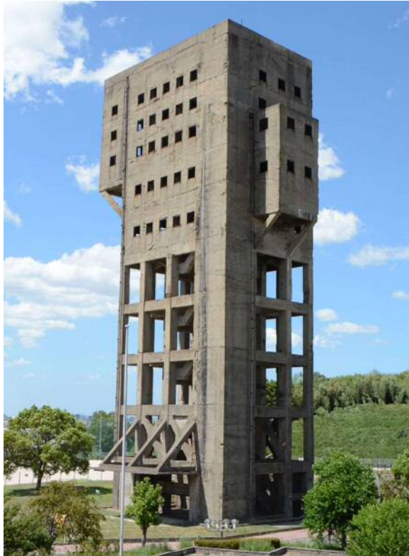
修理工事着手前の竪坑櫓

旧志免鉱業所竪坑櫓（きゅうしめこうぎょうしょたてこうやぐら）は建設から75年以上を経て、老朽化した部分の修理工事を行っています。このリーフレットでは竪坑櫓の歴史・概要と修理工事の概要を説明します。