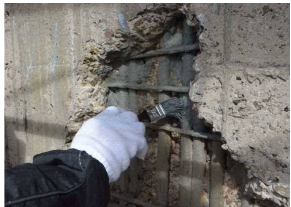
古い鉄筋にはさびを抑制する薬材を塗布します。このあとコンクリートの欠けた部分を埋めていきます