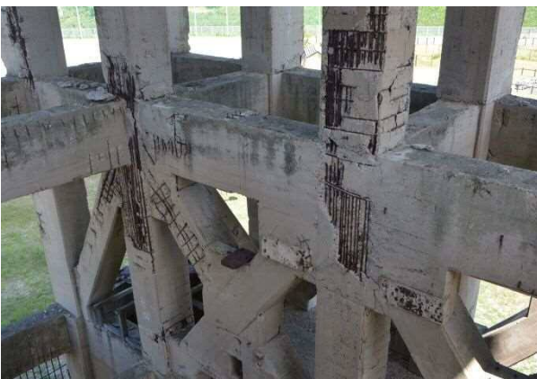
75 年の間に劣化したコンクリートがはがれ、なかの鉄筋が露出していました

平成 30 年 9 月から始まった修理は、修理方針を部分修理としています。それは、適切な補修により劣化の進行を抑制し、コンクリートを健全な状態に戻し、堅坑櫓の崩壊を防ぐことを目的とします。