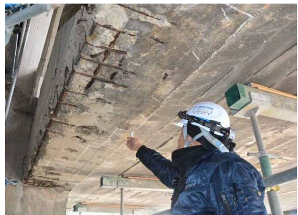
修理に先立ってコンクリートの悪くなった部分を調査し、マーキングしていきます