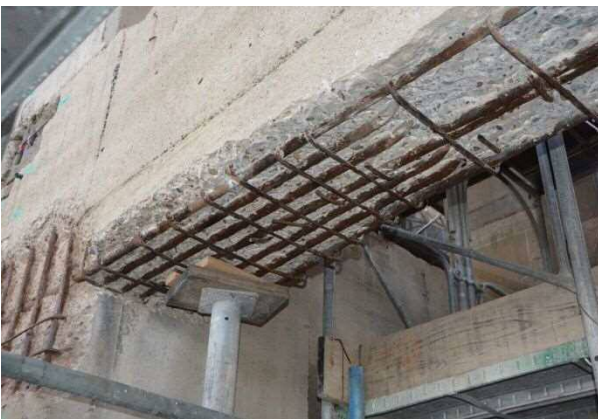
表面の劣化したコンクリートだけを電動ドリル等を使ってはがしたところです