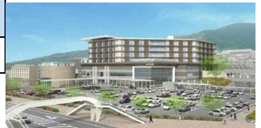
新八幡病院建設かわら版HPより