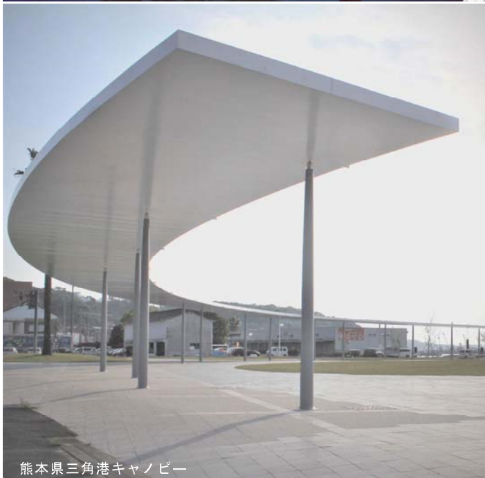
熊本県三角港キャノピー