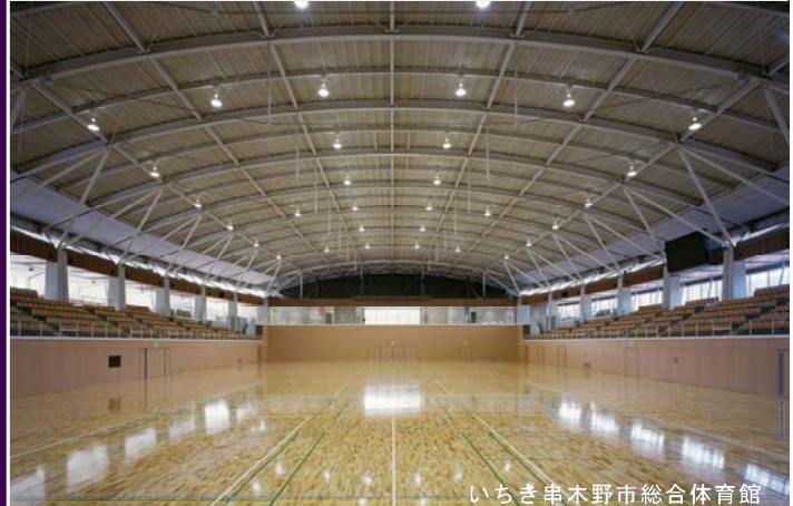
いちき串木野市総合体育館