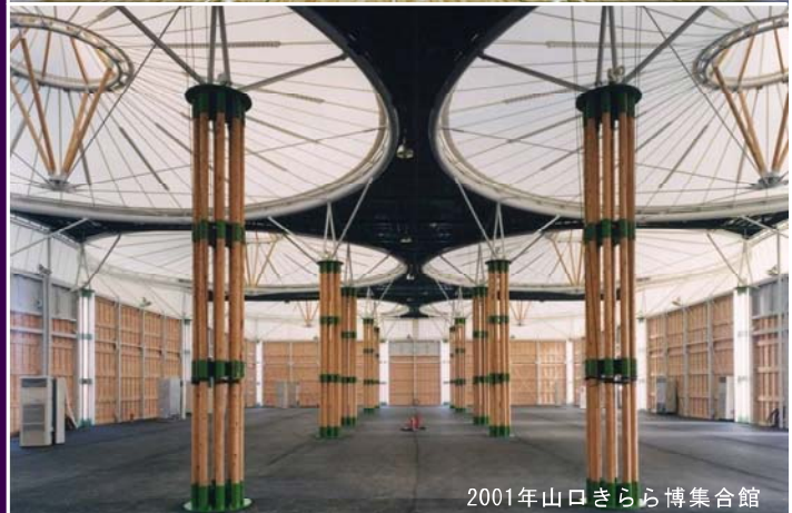
2001年山口きらら博集合館