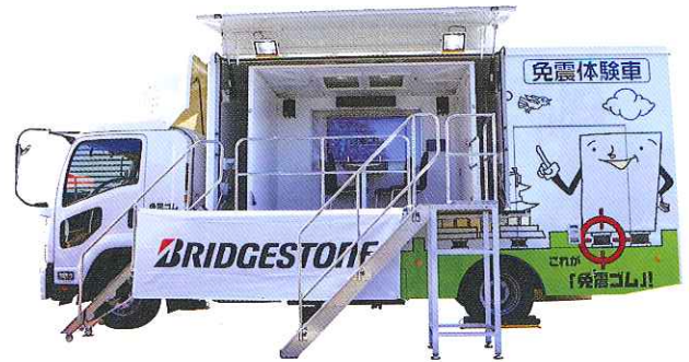
(免震体験車 設営事例)